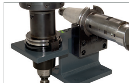
С комбинацией инструментальных оправок