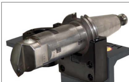
С горизонтальной установкой инструментальной оправки